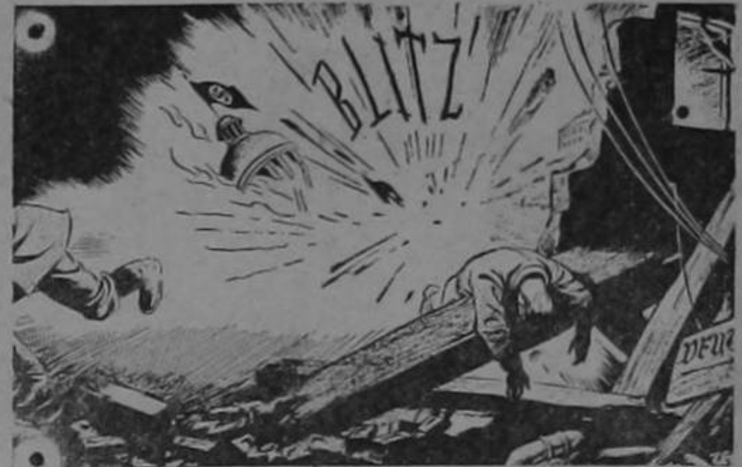
ENSEÑANDO EL ALEMAN A LOS ALEMANES.