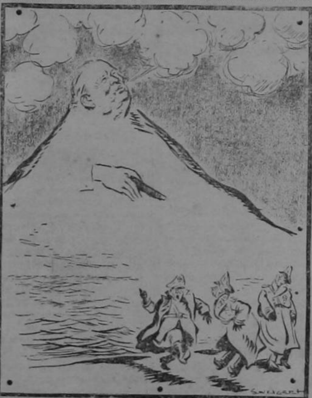
"Cuidado que cuando echa humo es señal de que va a entrar en erupción...!"

La Semana, como dijimos antes, es una chica muy guapa y muy honesta, pero que todos los sábados se echa a la calle a rebuscarse!