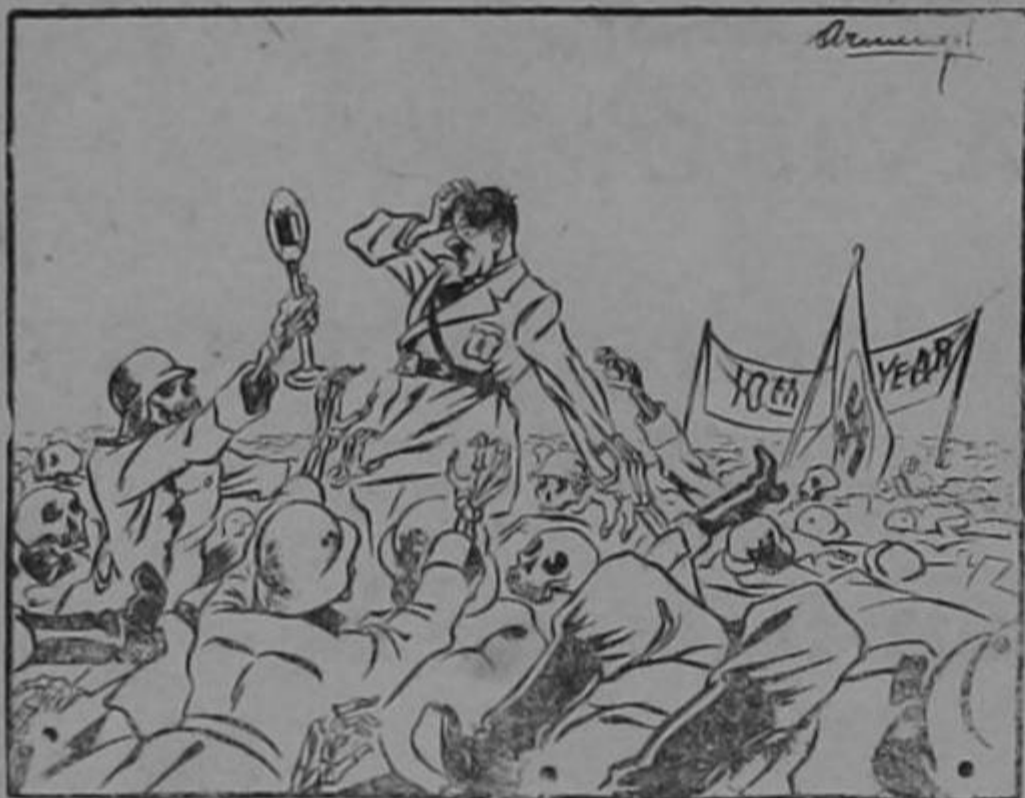
LA ELOCUENCIA DEL SILENCIO