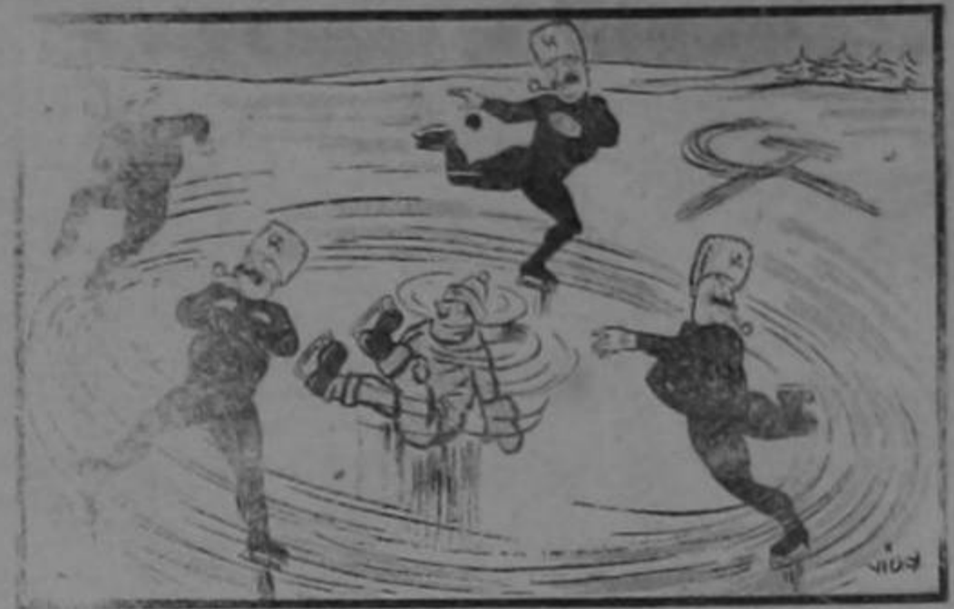
"surrounding movements are purely German conceptions."—German Newspaper

¡Qué manera de decir y de escribir! ¿No cree el señor Canales que debió decir: "Numerosas personas que frecuentan DE invierno a invierno y DE verano a verano..."? En