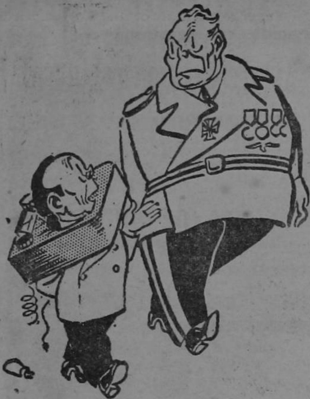
Goebbels: "No sé por qué me parece que no estaba muy satisfecho con las noticias..."

¿Ya le dió su adhesión a don Teodoro o se apunta a la lista del yodo?