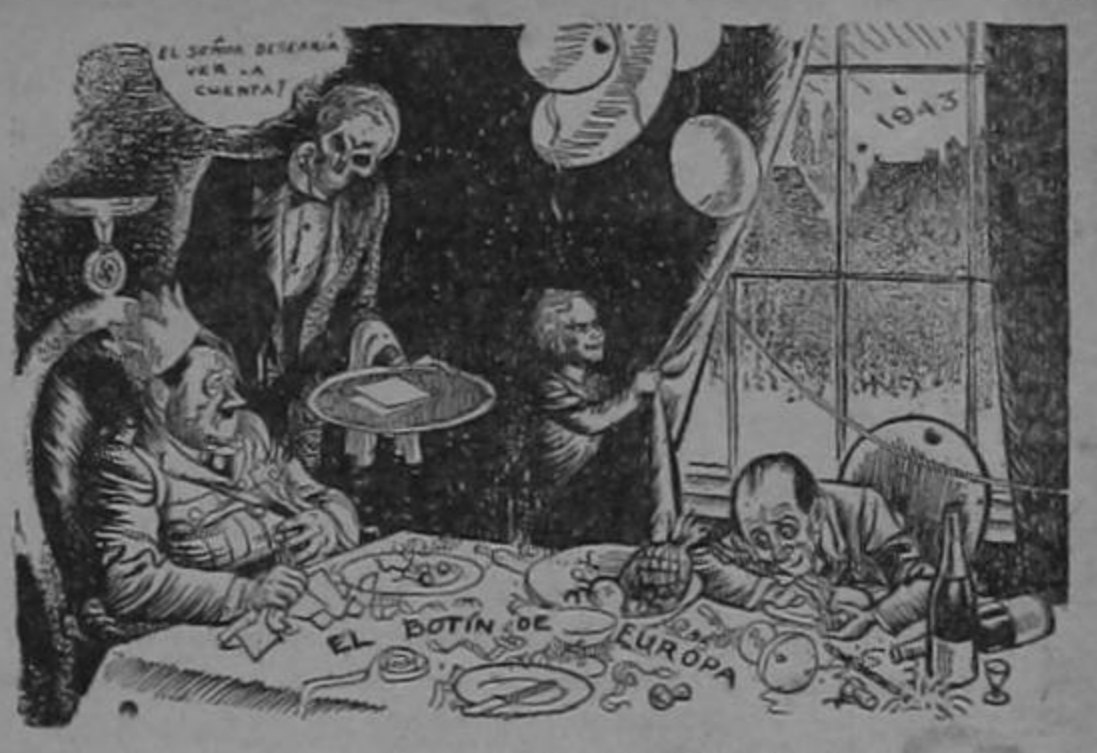
A LA MAÑANA SIGUIENTE...