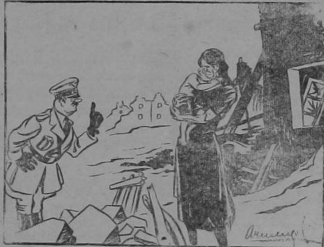
VAS A VER LO QUE ES LA GUERRA