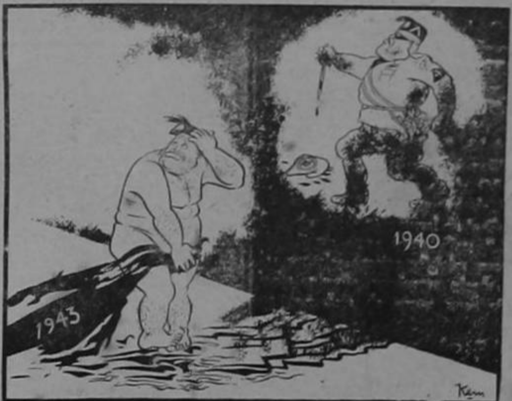
EN EL CASTIGO VA LA PENITENCIA